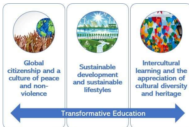
3 obszary tematyczne działania ASPnet

"Do 2030 r. należy zapewnić, że wszyscy uczący się nabeżdą wiedzę i umiejętności potrzebne do promowania zrównoważonego rozwoju, w tym między innymi poprzez edukację na rzecz zrównoważonego rozwoju i zrównoważonego stylu życia, edukację na rzecz zdrowia i dobrostanu, praw człowieka, równości płci, promowania kultury pokoju i niestosowania przemocy, globalnego obywatelstwa i uznania wartości różnorodności kulturowej oraz wkładu kultury w zrównoważony rozwój".