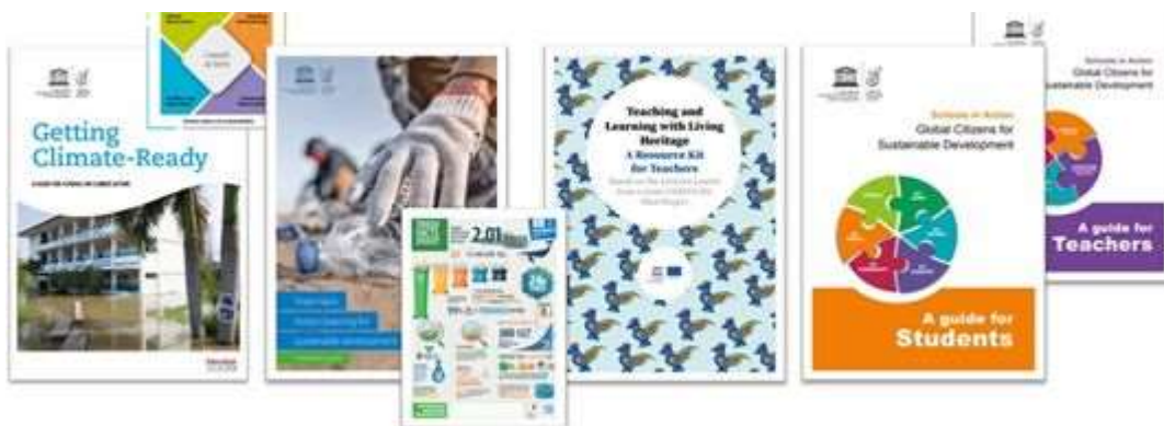
Przykłady odpowiednich zasobów ASPnet związanych z transformacyjną edukacją na rzecz globalnego obywatelstwa, zrównoważonym rozwojem oraz rozwojem i zrozumieniem międzykulturowym

Wysiłki w tym zakresie są podejmowane i muszą być dalej wspierane i badane, aby lepiej zrozumieć i wykorzystać podejście do szkoły jako całości, które niesie z sobą ogromny potencjał w zakresie holistycznej i włączającej transformacji szkolnej, nie tylko w odniesieniu do zmian klimatu, ale także innych globalnych wyzwań, do których odnosi się edukacja na rzecz zrównoważonego rozwoju i globalna edukacja obywatelska.